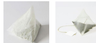
三角ティーバッグ (紐の有無)